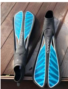
Tribord piscine 44 - 45