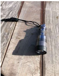
Lampe scubapro Nova 720R

Il manque le chargeur Elle a l'air récente