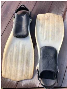
Mares Power plana carrière 44-45