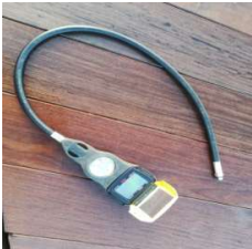
Aladin plus avec une nouvelle pile