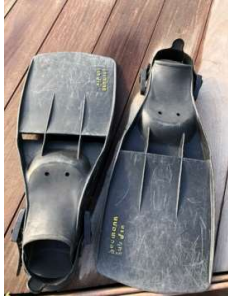
Seemann Sub Fin carrière 44-45