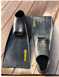
Mares Vola piscine 44-45