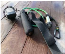
Lampe Green Force